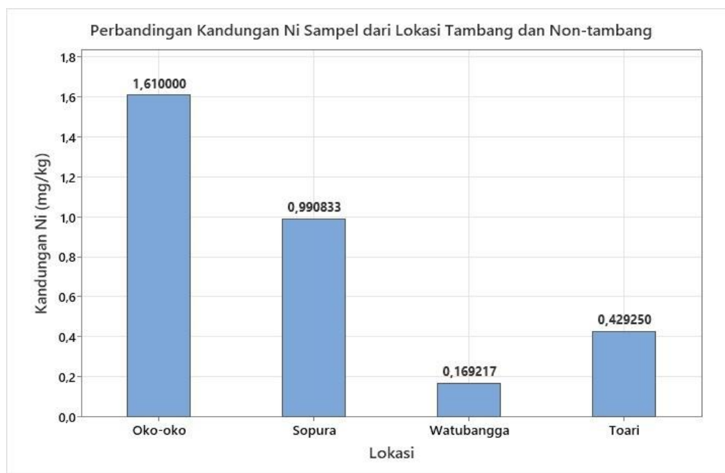
Gambar 3. Perbandingan kandungan Ni (Nikel) di lokasi tambang dan non tambang

secara langsung mengonfirmasi dampak dari aktivitas pertambangan nikel-laterit (open-pit mining) dan pengolahan bijih nikel yang masif di wilayah Pomalaa, Kabupaten Kolaka. Bagi masyarakat konsumen, mengonsumsi daging sapi dengan kadar Ni di atas batas acuan secara kontinu dalam jangka panjang dapat menimbulkan ancaman bahaya kesehatan kronis, termasuk risiko reaksi hipersensitivitas, dermatitis kontak, gangguan sistem imun, hingga potensi karsinogenik (ATSDR, 2020; Pramesti et al. , 2020).