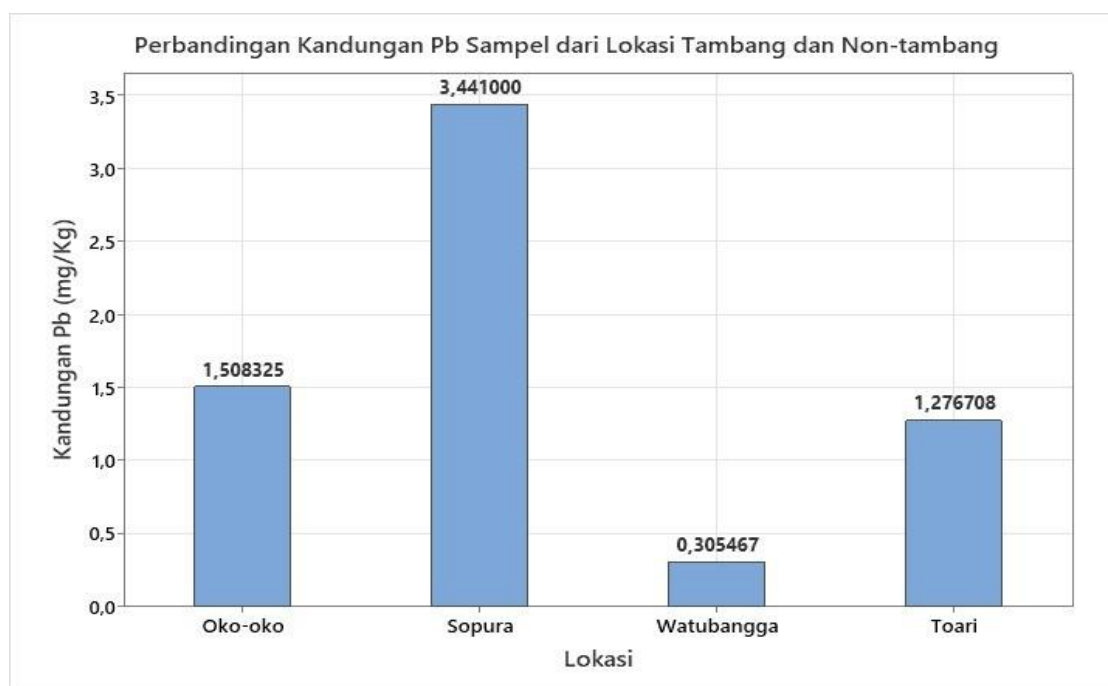
Gambar 1. Perbandingan kandungan Pb (Timbal) di lokasi tambang dan non Tambang

tinggi (seperti area pembuangan sampah atau kawasan industri) menunjukkan akumulasi Pb yang signifikan pada jaringan tubuhnya (Putra et al. , 2018). Aktivitas mekanis pertambangan nikel secara intensif memicu mobilitas logam di lingkungan melalui penyebaran debu partikal, aliran air permukaan, dan erosi tanah (Salim et al. , 2023). Partikel logam Pb yang terdispersi ke udara ini kemudian mengendap pada rumput penggembalaan dan tanah, yang menjadi rute paparan utama bagi ternak sapi potong setempat.